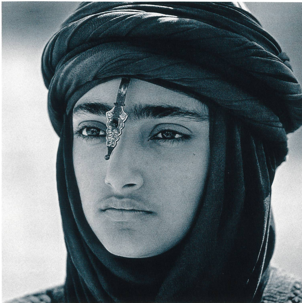
Produktion: CARTHAGO FILMS, Paris; Verleih Schweiz: trigon-film, Basel.