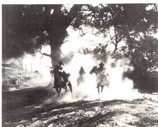
THE FOUR HORSEMEN OF THE APOCALYPSE (1920)