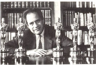
SCHINDLER'S LIST Steven Spielberg