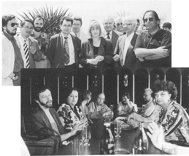
Bild oben: FIPRESCI-Jury Cannes 1994 Bild unten: FIPRESCI-Jury Sochi 1995