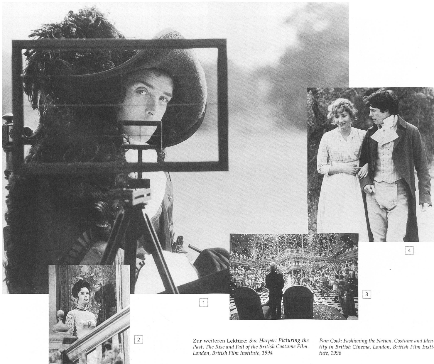
Zur weiteren Lektüre: Sue Harper: Picturing the Past. The Rise and Fall of the British Costume Film. London, British Film Institute, 1994