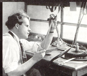
Sergej M. Eisenstein