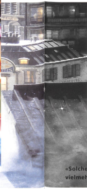
«Solche Zeitlupen sind nicht zur genaueren, detaillierteren Betrachtung da, vielmehr schaffen sie einen trancehaften Effekt, ein merkwürdiges Gefühl des Irrealen.»