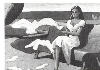
THE BIG TRAIL Regie: Raoul Walsh