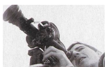
Titelblatt: Rebecca Romijn-Stamos und Antonio Banderas in FEMME FATALE von Brian De Palma