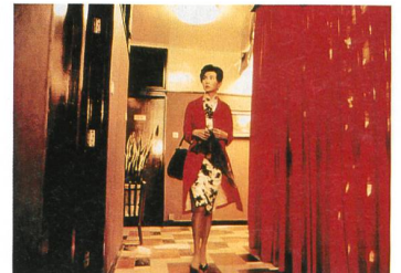
Maggie Cheung in IN THE MOOD FOR LOVE Regie: Wong Kar-wai