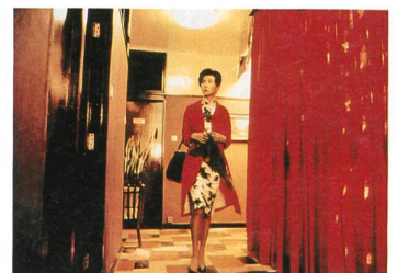
Maggie Cheung in IN THE MOOD FOR LOVE Regie: Wong Kar-wai