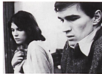
SUNDAY AT SIX Regie: Lucian Pintilie