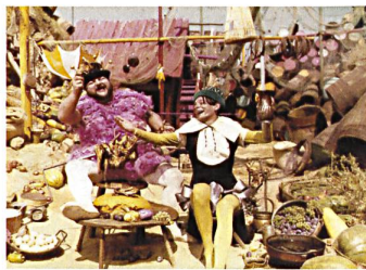
THE WHITE MOOR Regie: Ion Popescu-Gopo