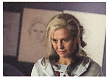
Julie Christie in AWAY FROM HER Regie: Sarah Polley