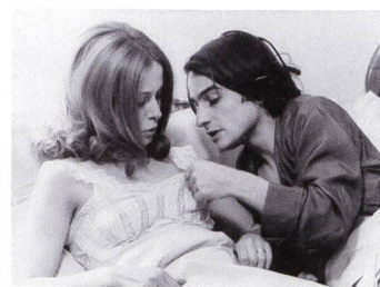
Claude Jade und Jean-Pierre Léaud in DOMICILE CONJUGAL Regie: François Truffaut