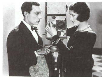
Buster Keaton in THE CAMERAMAN Regie: Buster Keaton