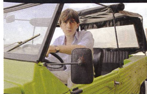
FORTAPÀSC (Marco Risi)