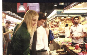
GENERAZIONE MILLE EURO (Massimo Venier)