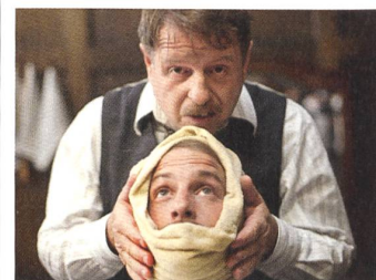
EINE WEN IIG, DR DÄLLEBACH KARI Regie: Xavier Koller