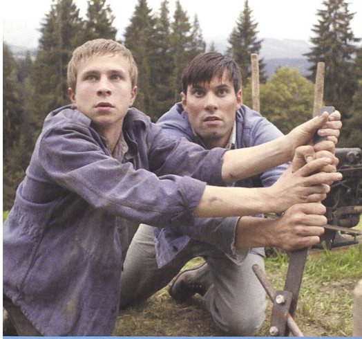
→ Nominiert Bester Kurzfilm «Quartz 2012» Emile de 1 à 5 von Lionel Baier