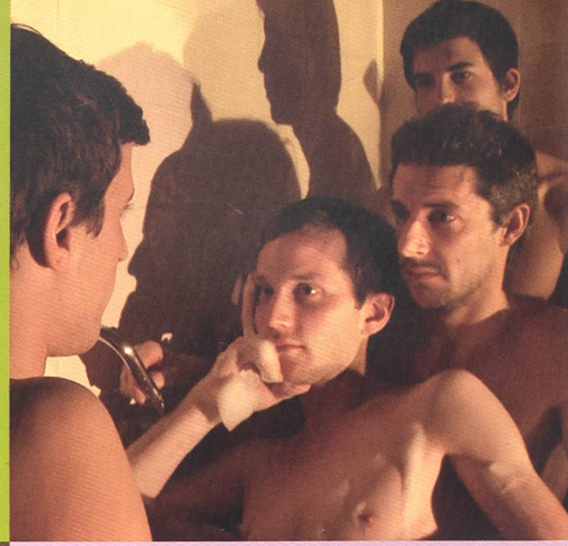
← Nominiert Bester Dokumentarfilm «Quartz 2012» Balkan Melodie von Stefan Schwieter

↑ Nominiert Bester Spielfilm «Quartz 2012» Der Verdingbub von Markus Imboden Nominiert Bester Dokumentarfilm «Quartz 2012» The Substance von Martin Witz ↓