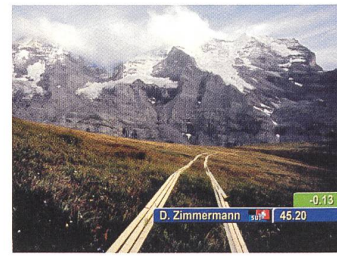
LAUBERHORNRENNEN IM SOMMER Regie: Daniel Zimmermann