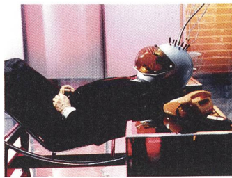
WELT AM DRAHT Regie: Rainer Werner Fassbinder