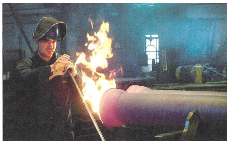
TOUT UN HIVER SANS FEU von Greg Zglinski (2005)

Fest verschliessbare Türen für alle Eisenbahnwagen müssten Vorrang haben gegenüber den digitalen Techniken der Bespitzelung und des Zurschaustellens. Doch scheint zwischen den zwei Extremen nichts Drittes gegeben: ähnlich wie zwischen dem vorschnellen Alfred und dem bedächtigen Jurek, die keinen Ausgleich finden. Fragt sich bloss, ob die Firma der Beiden, eines von vielen Internet-Fernsehprogrammen, auf die düsteren Geschehnisse in der Besitzerfamilie warten musste, um ins Prekäre zu verrutschen und unters Rad des sogenannten Wachstums zu geraten. Ein Bruder weniger, endlich. Die Geier warten schon. Ob es nach Verwesung riecht oder nach Frischfleisch, der freie Markt leckt sich die Finger. Bieter, Makler klopfen an, wegen steigender oder sinkender Werte und Preise. Polen scheint in die mobile Zukunft integriert: ein Spielball mehr.