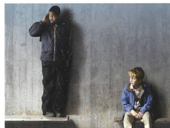
PLAY Regie: Ruben Östlund