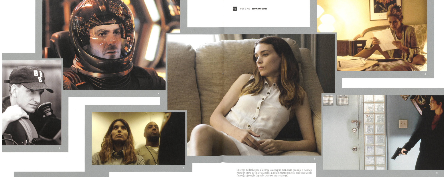
1 Steven Soderbergh; 2 George Clooney in SOLARIS (2002); 3 Rooney Mara in SIDE EFFECTS (2013); 4 Julia Roberts in ERIN BROCKOVICH (2000); 5 Jennifer Lopez in OUT OF SIGHT (1998)