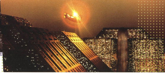
1 William Dafoe in to live and die in L.A. , von William Friedkin (1983); 2 Harrison Ford in blade runner von Ridley Scott (1982)