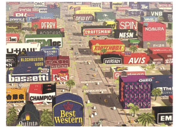
LOGORAMA Regie: Hervé de Crécy, François Alaux, Ludovic Houplain