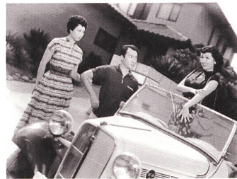
KARUMEN JUNJOSU (CARMENS REINE LIEBE) Regie: Keisuke Kinoshita