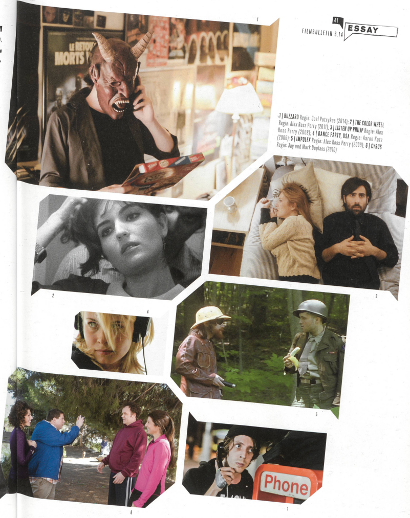
1 | BUZZARD Regie: Joel Potrykus (2014); 2 | THE COLOR WHEEL Regie: Alex Ross Perry (2011); 3 | LISTEN UP PHILIP Regie: Alex Ross Perry (2009); 4 | DANCE PARTY, USA Regie: Aaron Katz (2009); 5 | IMPOLEX Regie: Alex Ross Perry (2009); 6 | CYRUS Regie: Jay und Mark Duplass (2010)

THE COLOR WHEEL treibt die klastrophobische Selbstbenügligkeit und Beengung, die manche Mumblecore-Filme (insbesondere die von Joe Swanberg) ausstrahlen, auf die Spitze – und lässt sie ins offen Pathologische kippen. JR lebt eine Narzisstin sondergleichen, ihr Bruder lebt antriebslos vor sich hin; und die anderen Menschen, denen die beiden auf ihrer Odyssee