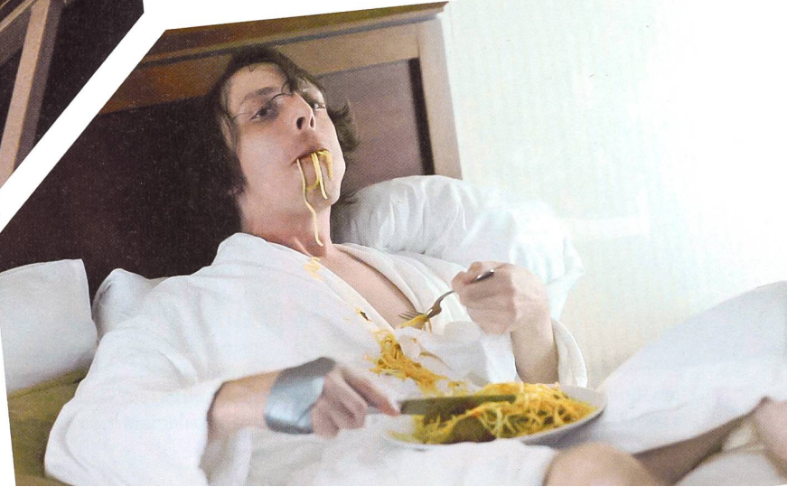
1 | COMPUTER CHESS Regie: Andrew Bujalski (2013); 2 | BUZZARD Regie: Joel Potrykus (2014); 3 | CYRUS Regie: Jay und Mark Duplass (2010); 4 | APE Regie: Joel Potrykus (2012); 5 | LISTEN UP PHILIP Regie: Alex Ross Perry (2014); 6 | BAGHEAD Regie: Jay und Mark Duplass (2008)