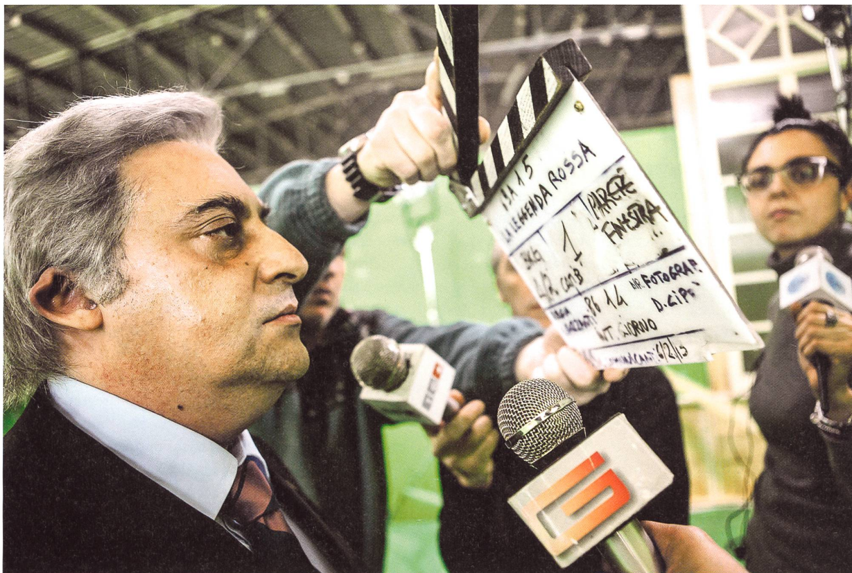
1 LA TRATTATIVA von Sabina Guzzanti 2 Al Pacino in THE HUMBLING von Barry Levinson