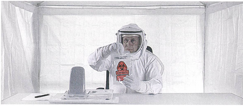
The Visit Simulation einer Begegnung