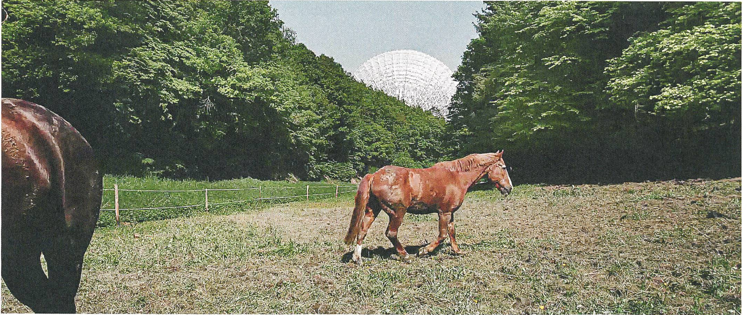
The Visit Eine Frage der Kommunikation