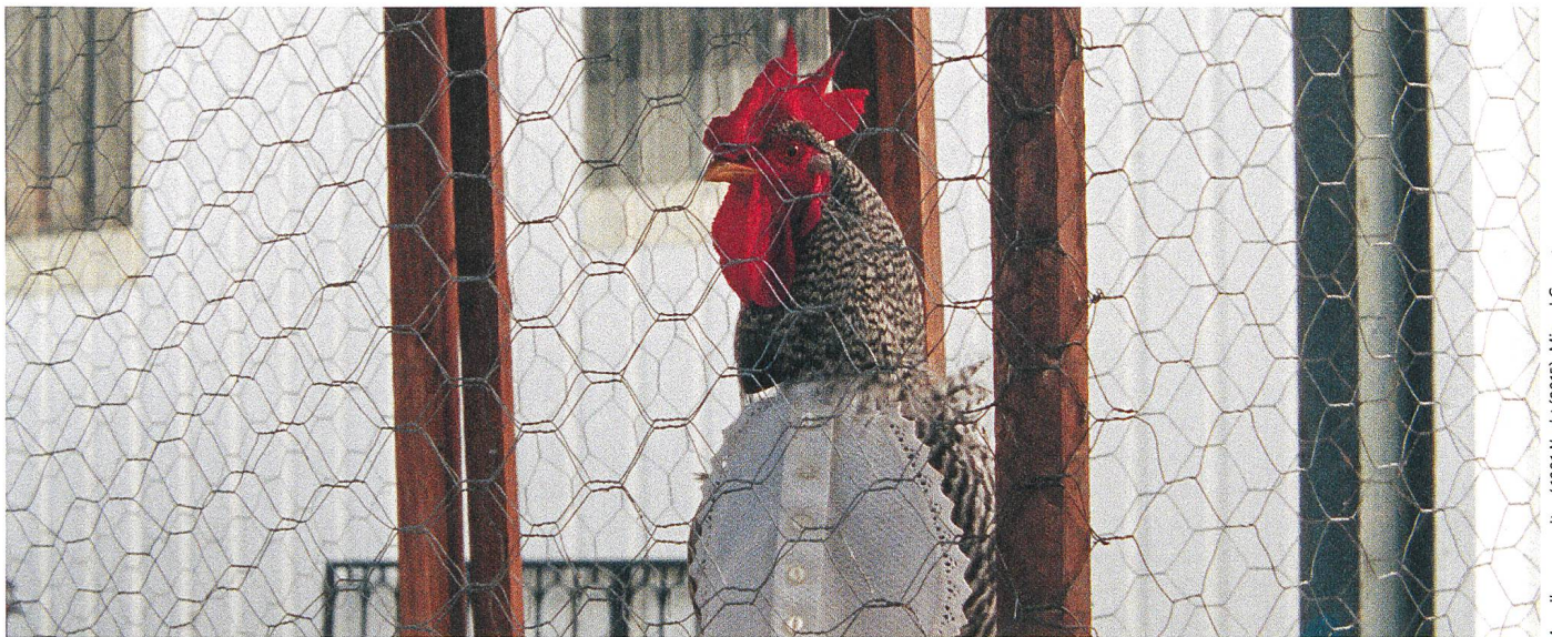
As mil e uma noites / 1001 Nacht (2015), Miguel Gomes