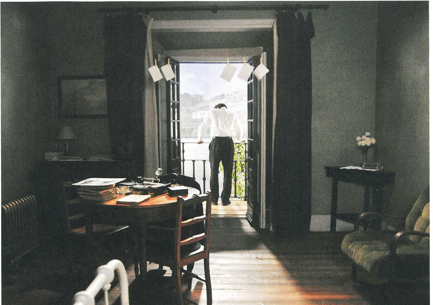
O estranho caso de Angélica (2010)