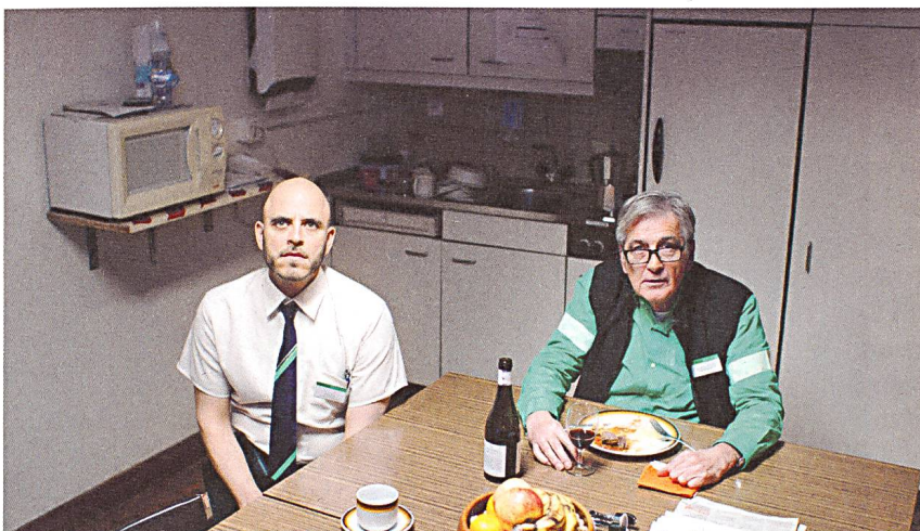
Heimatland düstere Aussichten