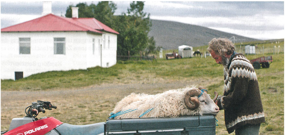
Hrútar abgelegener Hof im Norden Islands