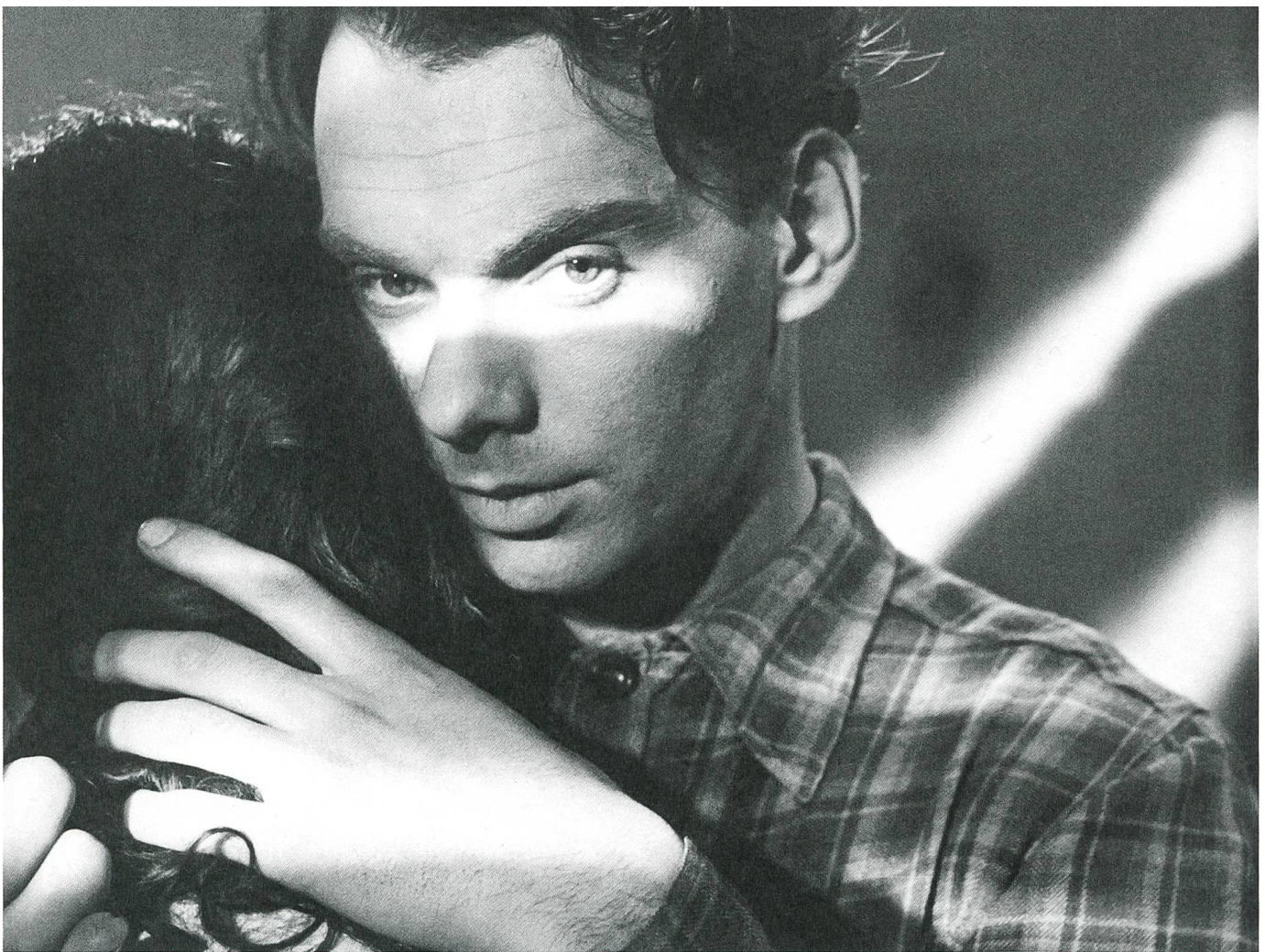
Letjat schurawli / Wenn die Kraniche ziehen (1957) Regie: Michail Kalatosow

Ungarn, stellte der Vorstand des Schweizerischen Lichtspieltheater-Verbandes fest, dass «dank der bestehenden privatwirtschaftlichen Ordnung des schweizerischen Filmwesens der Film kommunistischer Herkunft in der Schweiz keine Rolle spielt. Er appelliert mit Nachdruck an seine Mitglieder, auch in Zukunft dafür zu sorgen, dass überhaupt kein Meter dieser Filme mehr vorgeführt wird.» («Schweizer Film Suisse», Nr. 11/1956) Ganz anders als in den dreissiger Jahren den Achsenmächten gegenüber fand jetzt in den Kinos tatsächlich eine Abgrenzung gegen Osten statt – zumindest bis 1958 der sowjetische Film Wenn die Kraniche ziehen von Michail Kalatosow in Cannes die Goldene Palme gewann und damit kommerziell attraktiv wurde. Die Ursache der Ängste der sich ans Kontingent klammernden Branche lag ohnehin nicht im Osten, sondern bei der west-ausländischen Konkurrenz.