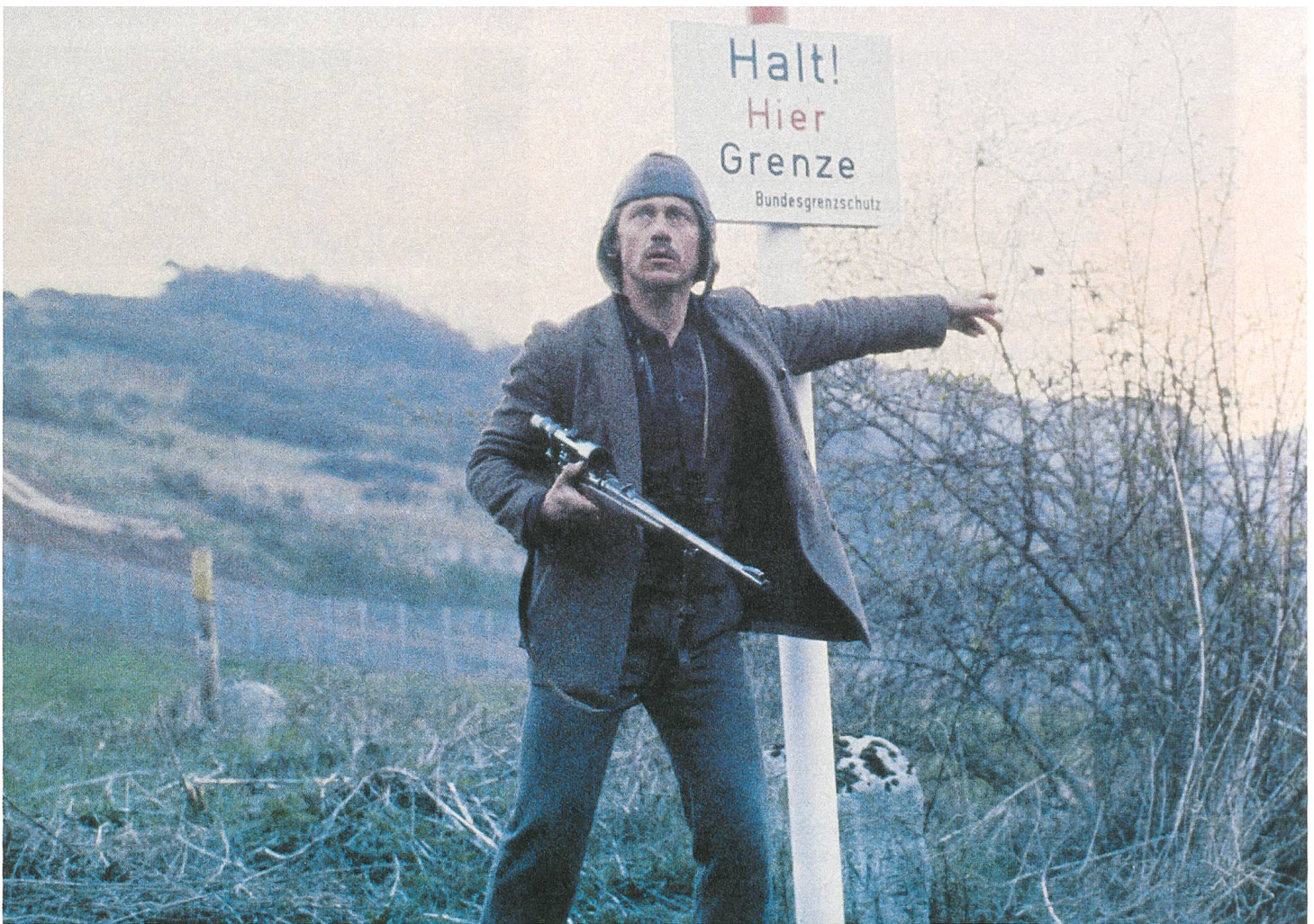
Der Will-Busch-Report (1979) Tilo Prückner in einem Film von Niklaus Schilling