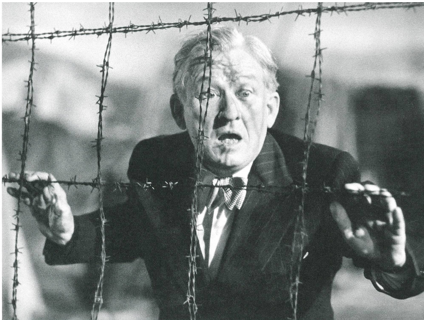
Ohm Krüger (1941) Regie: Hans Steinhoff, Karl Anton

durch eine freie, neutrale, unverblendete Zensurbehörde der Armee (sie ist es doch noch?) nicht anmerkt». Und er fragte: «Weshalb räumt man der nationalsozialistischen Propaganda jenen Platz ein, der von der anderen kriegführenden Partei als Verzicht auf Neutralität gedeutet werden kann?» (Brief von Dr. A. Landoldt, 29. 8. 1941)