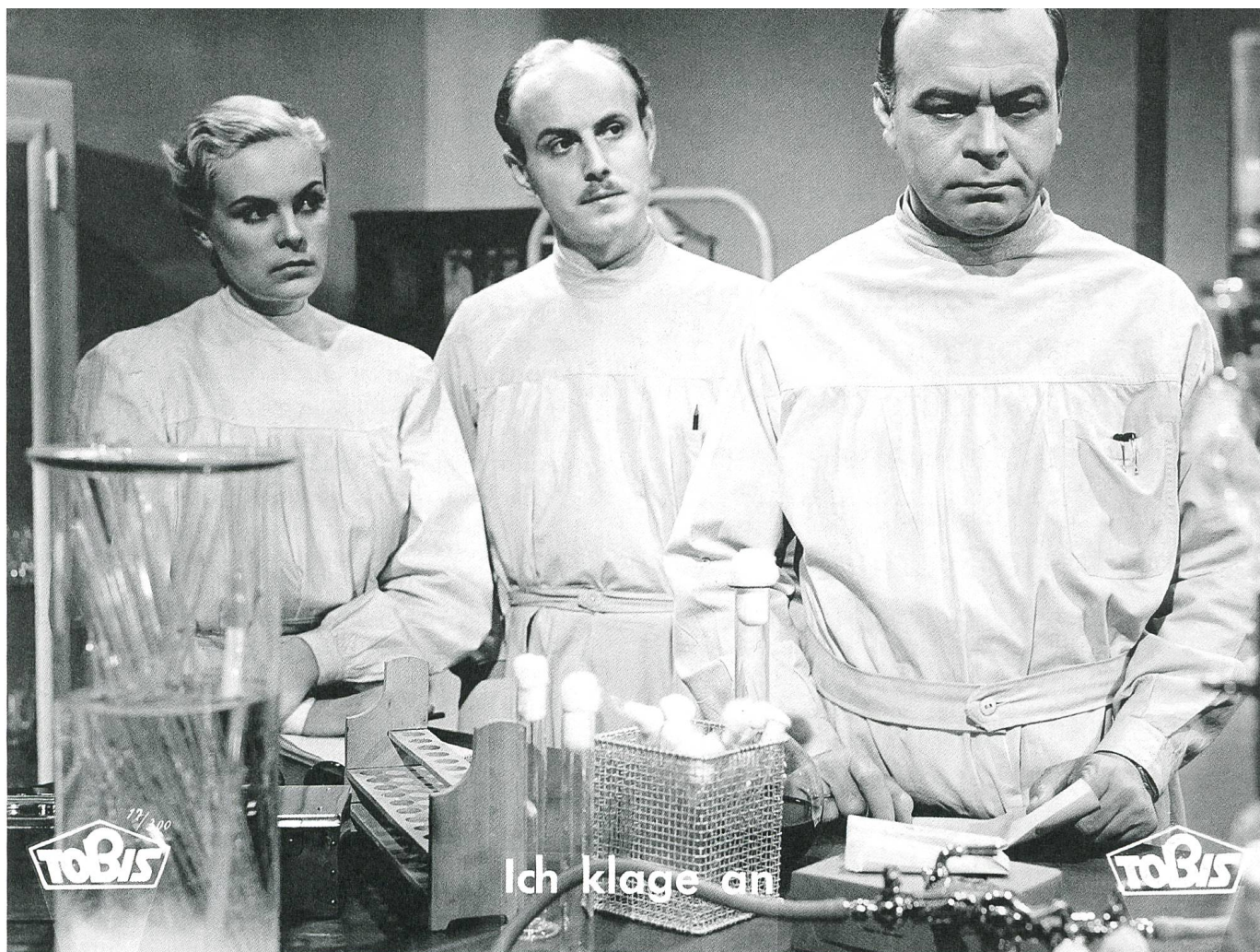
Ich klage an (1941) Pro-Euthanasie-Melodrama von Wolfgang Liebeneiner

des ausländischen Einflusses in der schweizerischen Filmwirtschaft schwerwiegende Folgen für das Land haben kann.» (NZZ, 12. 7. 1939) Im Ausland sah man, je nach Standort, die Sache etwas anders: Die «New York Herald Tribune» machte schon aufgrund der – offenbar nur bedingt vertraulichen – Beschlüsse der Filmkammer Stimmung gegen eine «Massnahme, die auf den Prinzipien des italienischen Filmmonopols beruht und dort die Ausschaltung amerikanischer Filme zur Folge hatte» (European Edition, 6. 7. 1939). Dagegen kommentierte das deutsche Branchenblatt «Film Kurier»: «Unseres Erachtens bedeutet diese Regelung eine Verewigung der Vormachtstellung, die in diesen Jahren die grossen amerikanischen Firmen auf dem Schweizer Markt errungen haben.» (14. 7. 1939)