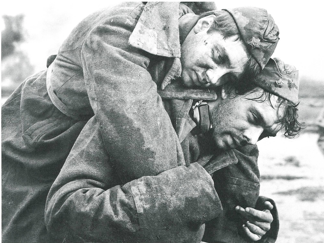
Letjat schurawli / Wenn die Kraniche ziehen (1957) Tauwetter-Melodrama

Dabei seien, meint H el ene Cardis (Path  Films) im Gespr ach, allerdings noch weitere Ver anderungen zu ber cksichtigen: Das Filmangebot habe sich weltweit in den letzten Jahrzehnten enorm ausgeweitet. Eine Einfuhrkontingentierung h atte sich ohnehin als Hindernis erwiesen, das gewachsene Angebot dem Schweizer Publikum zug anglich zu machen, und h atte schon deshalb nicht mehr lange Bestand haben k onnen. Zugleich sei die Konkurrenz um die Aufmerksamkeit des Publikums h arter und kostspieliger geworden. Das enge den Spielraum der Verleiher ein, sich auch einmal einen wirtschaftlich schw acheren, aber kulturell wertvollen Film im Programm zu leisten.