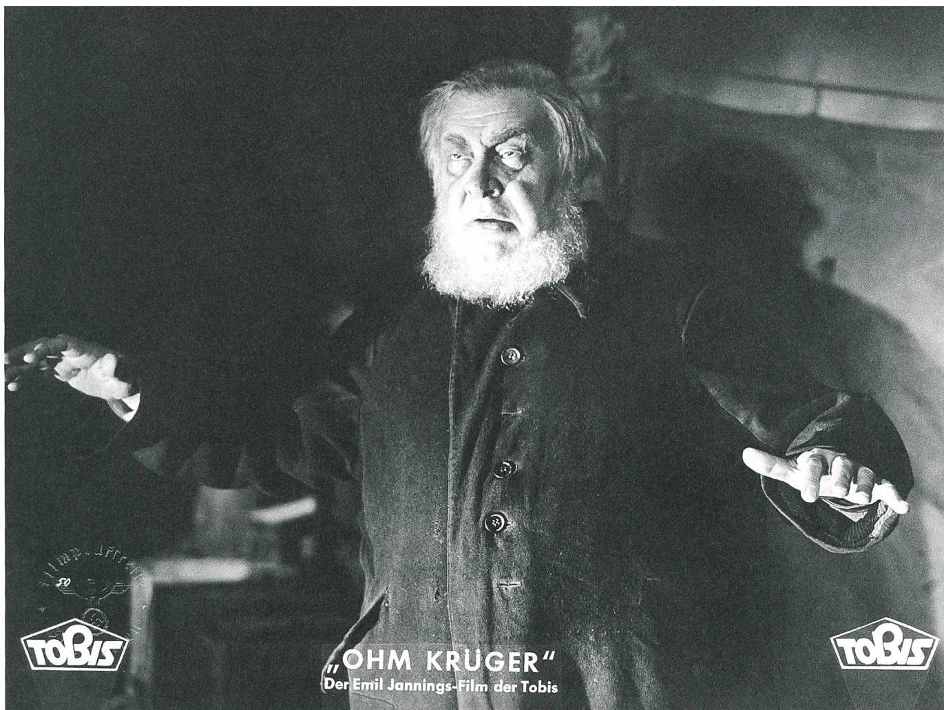
Ohm Krüger (1941) Emil Jannings

Filmmarktordnung» (festgeschrieben im «Interessen-Vertrag» vom 31. 5. 1939). Indem sie die Geschäftsbeziehungen exklusiv zwischen den Mitgliedern des Filmverleihverbandes und jenen der Kinoverbände zuliess, konnten Verleiher wie Kinobesitzer Aussen-seiter und unwillkommene Eindringlinge aus ihrem Geschäftsfeld ausschliessen.