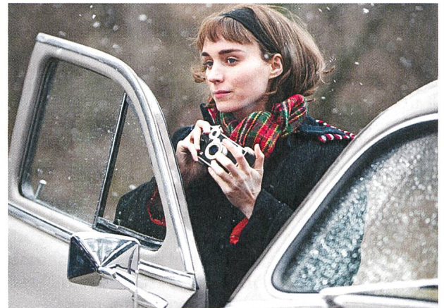
Carol (2015) Rooney Mara