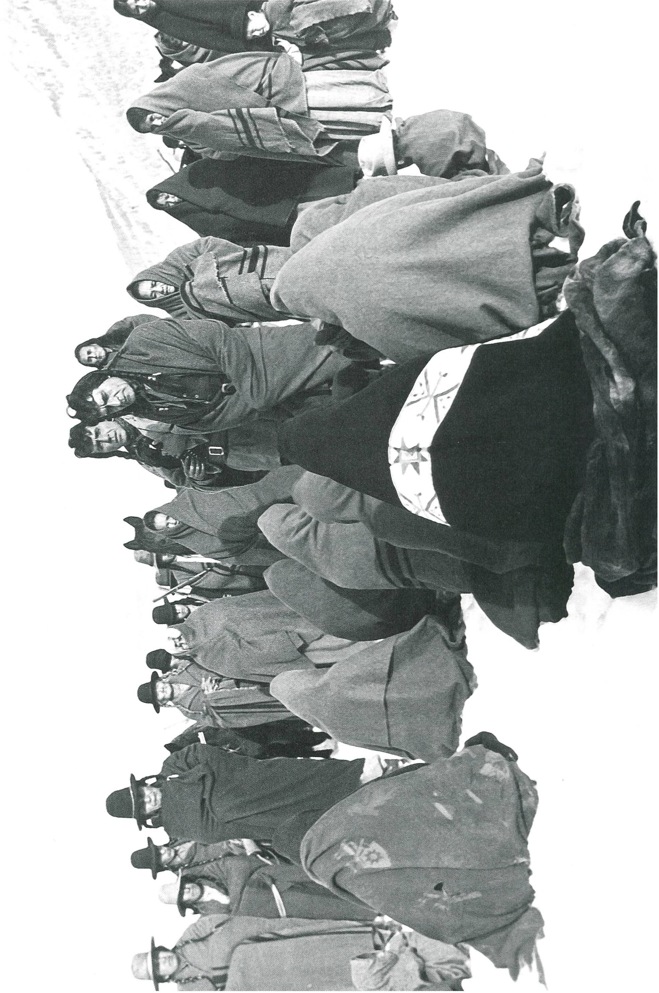
Cheyenne Autumn (1964) Wipeout: Massaker im Schnee