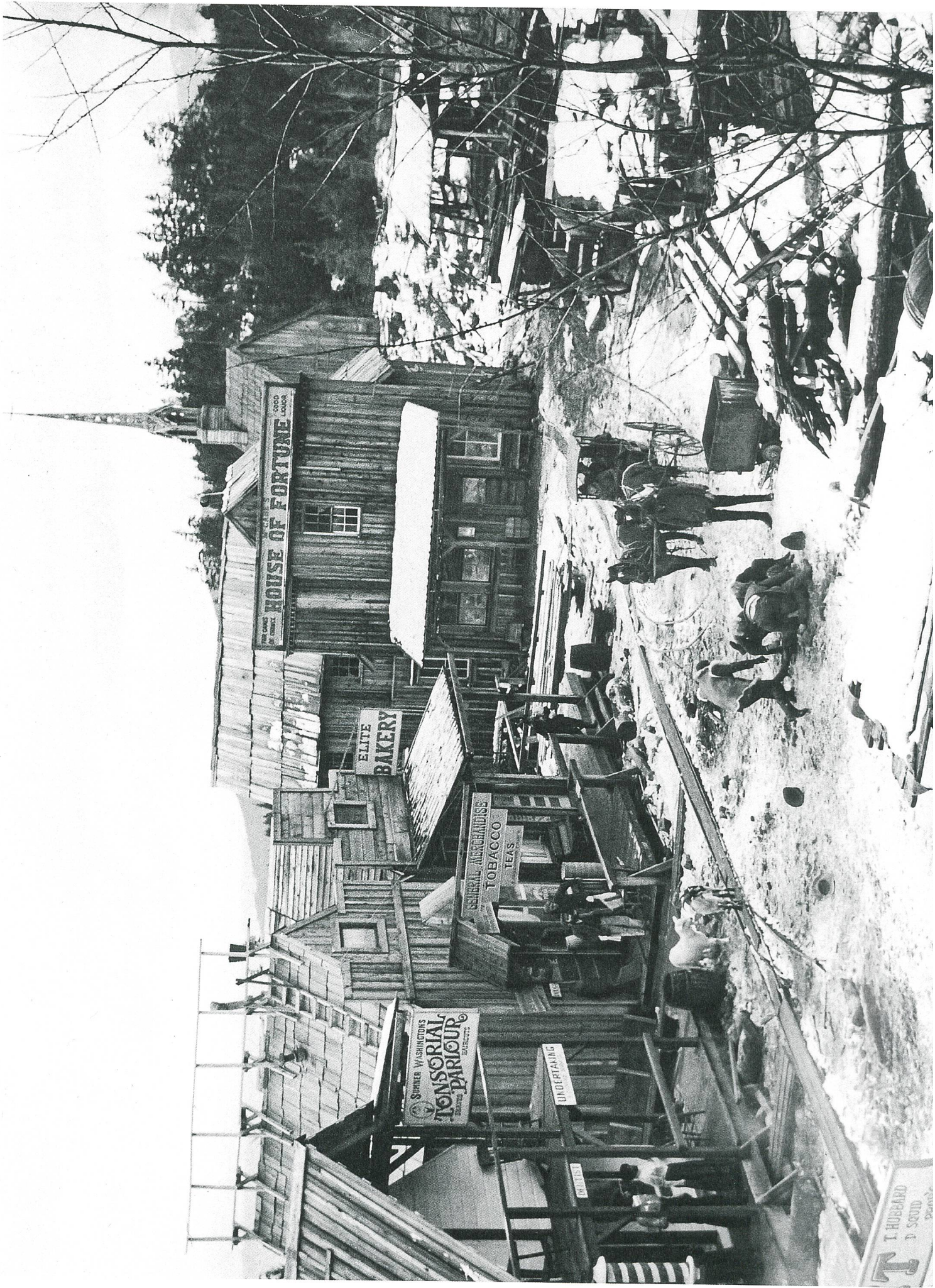
McCabe & Mrs. Miller (1971) Ein revisionistischer Western von Robert Altman