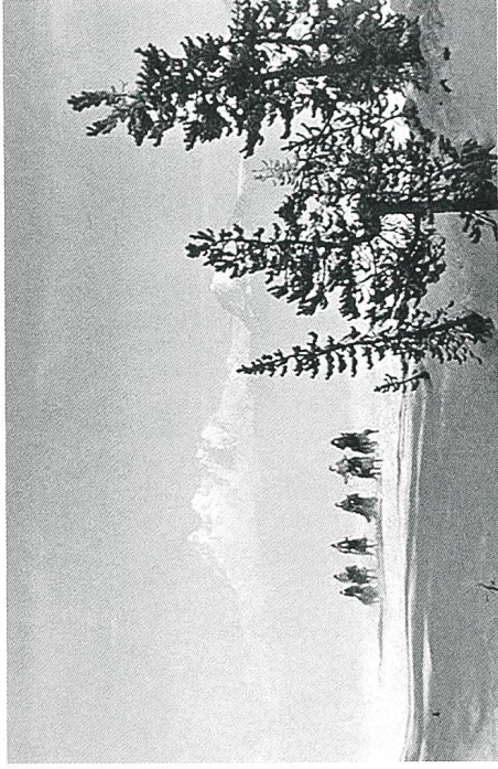
Day of the Outlaw (1959) Weiss, so weit das Auge reicht.

Kultur- und Medienwissenschaftler und freier Autor. Zu seinen Forschungsschwerpunkten zählen unter anderem das klassische und postklassische Hollywoodkino oder der Zusammenhang zwischen Filmtechnik, Psychiatrie und Psychoanalyse.