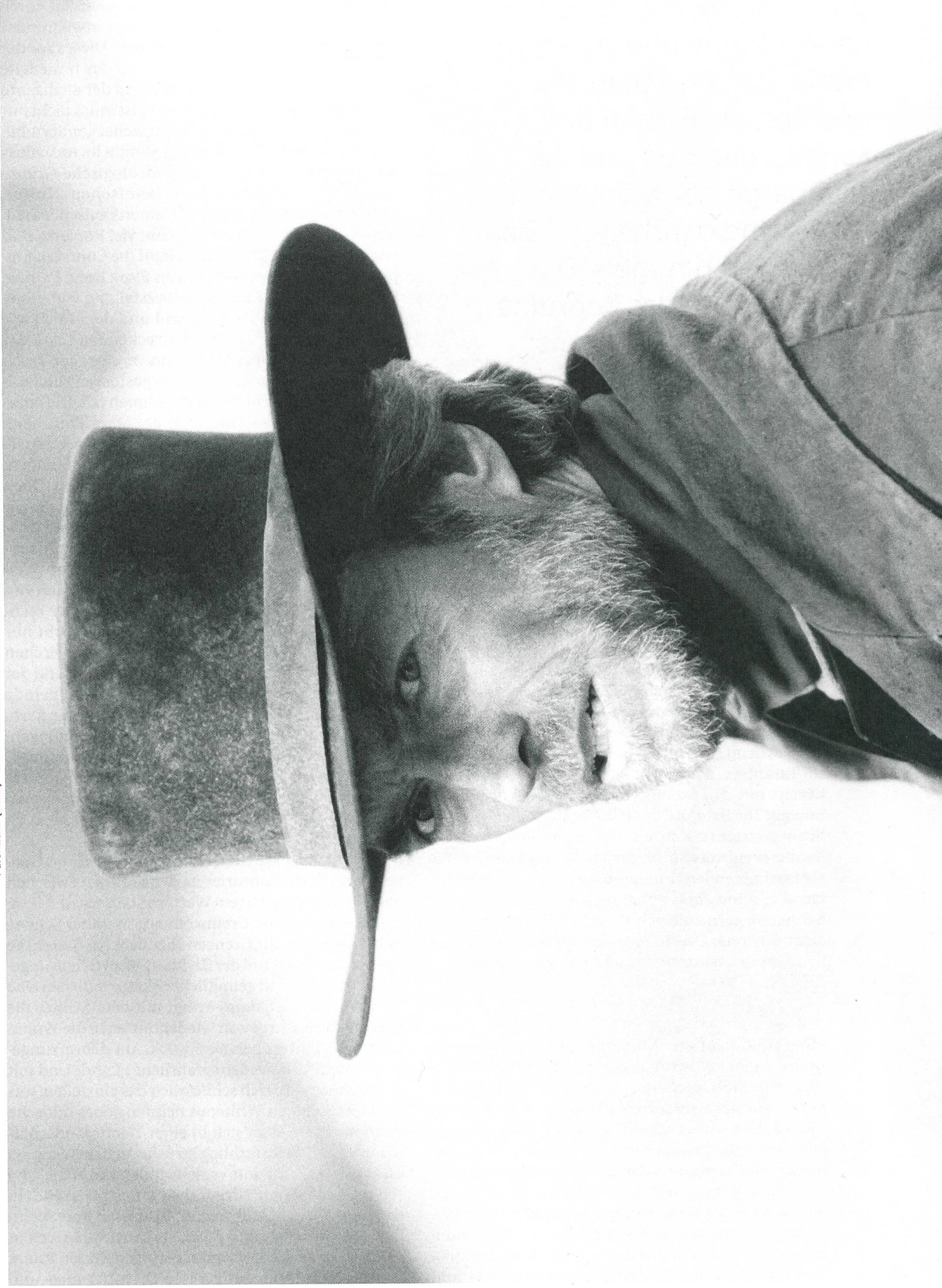
Pale Rider (1985) Clint Eastwood als unsterblicher Reiter, der aus dem Schnee kam.