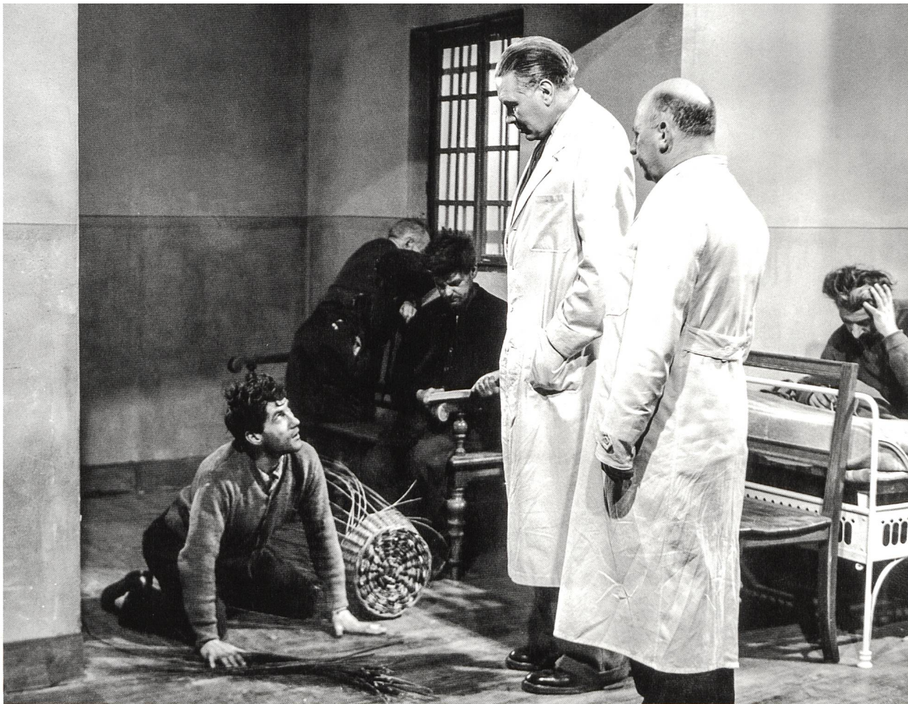
Bilder geben Übertragungen zwischen Film und Psychiatrie S. 46