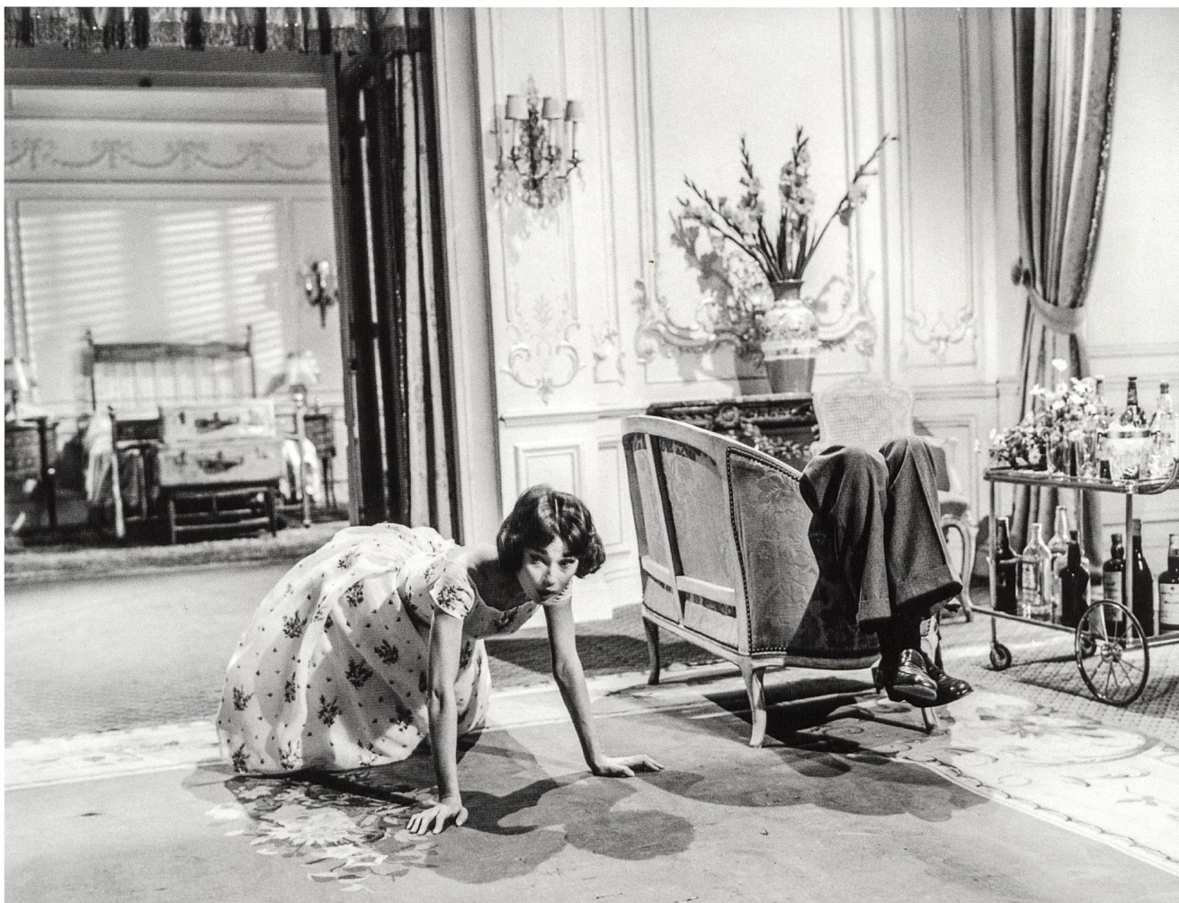
Hotel im Kino Eine Welt für sich S. 6