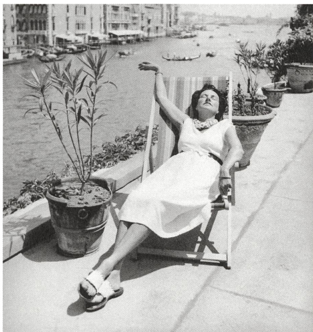
Peggy Guggenheim: Art Addict (2014) Kritik S. 31