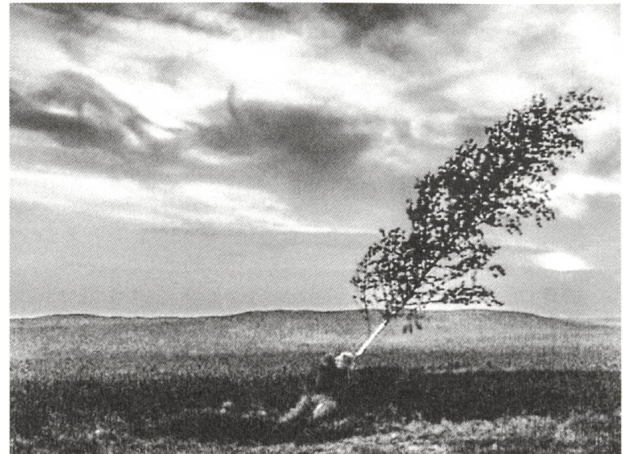
Die Jungfrauenquelle (1960) Regie: Ingmar Bergman