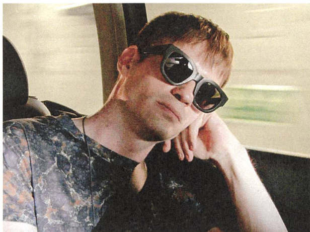
Electroboy (2014) Der Spoiler S. 17