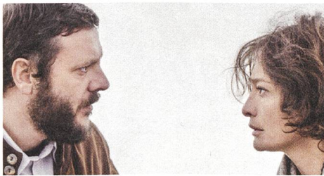
Der Pfarrer kümmert sich