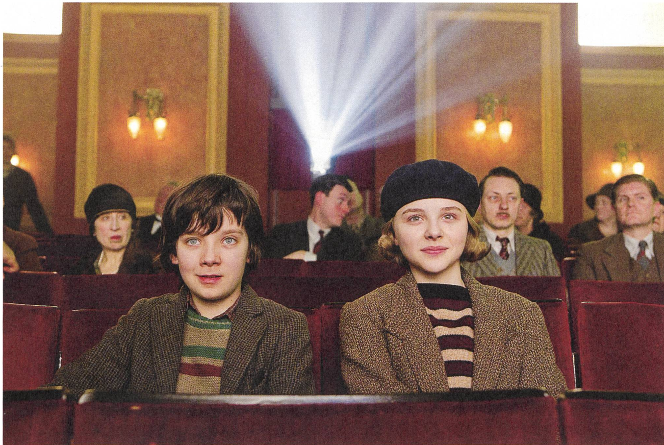
Hugo (2011), Regie: Martin Scorsese