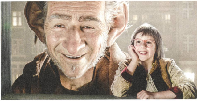
The BFG Mark Rylance und Ruby Barnhill