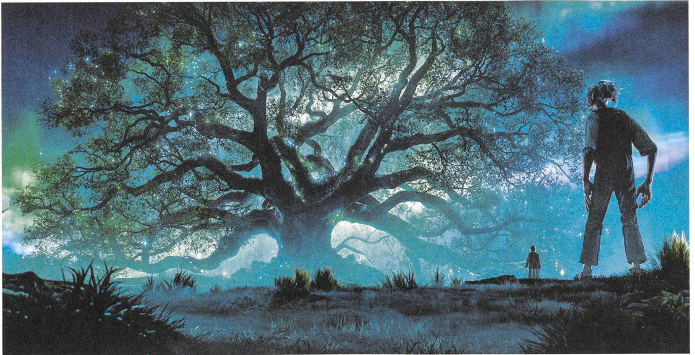
The BFG Im Land der Träume