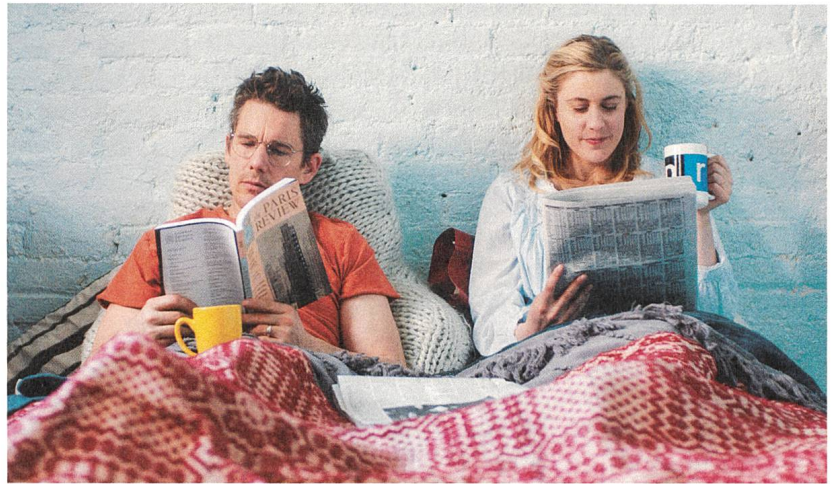
Maggie's Plan Zufrieden, aber nicht lange