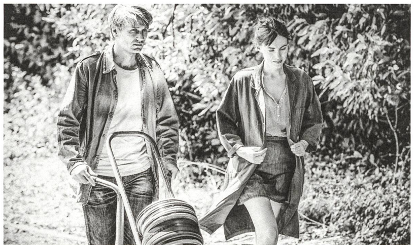
L'ombre des femmes Seitensprung: eine männliche Selbstverständlichkeit