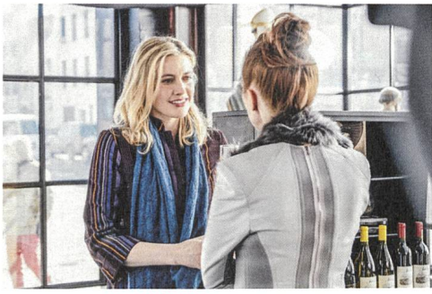
Maggie's Plan Greta Gerwig