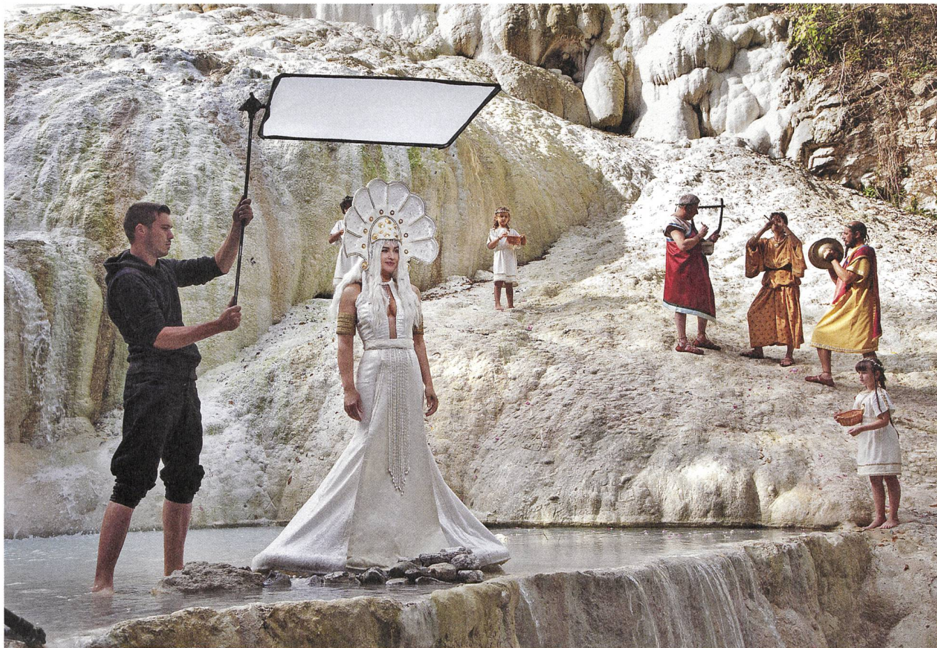
Le meraviglie (2014). Regie: Alice Rohrwacher, Produzentin: Tiziana Soudani