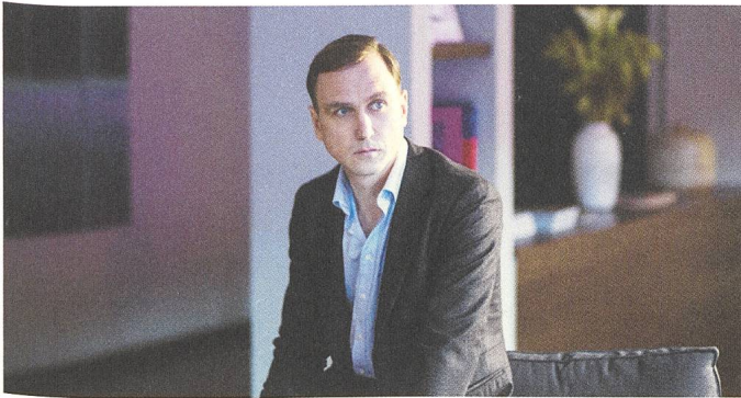
Personal Shopper Lars Eidinger