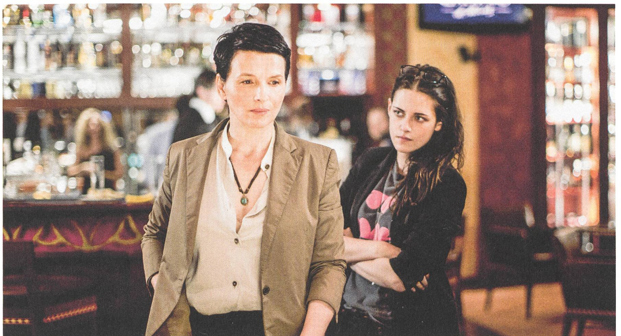
Clouds of Sils Maria Juliette Binoche und Kristen Stewart