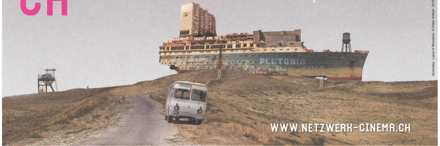
«Subotika - Land of Wonders» © Peter Volkart 2015

FILM STUDIEREN AUF MASTER- UND DOKTORATSSTUFE · FILMWISSENSCHAFT FILMREALISATION