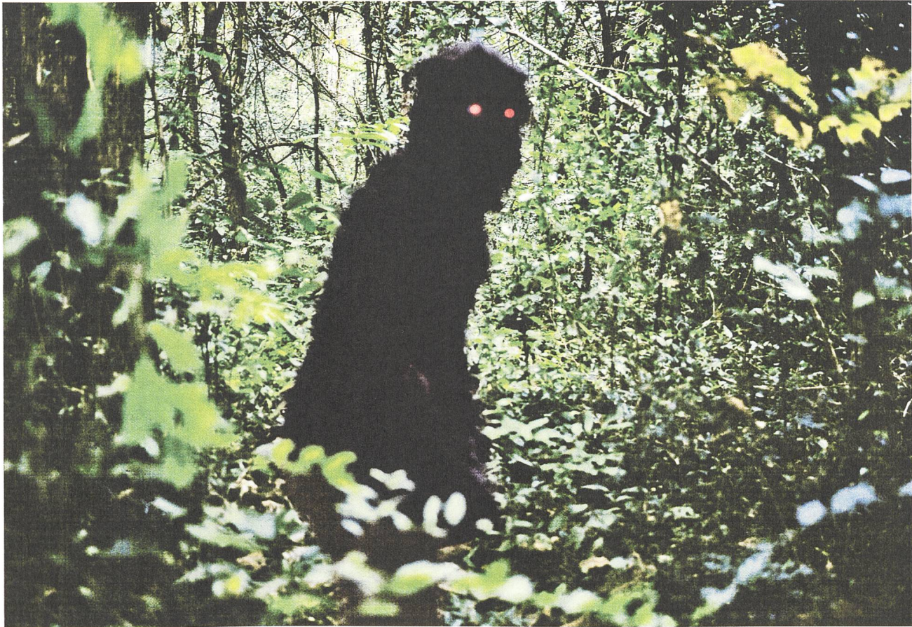
Uncle Boonmee Who Can Recall His Past Lives (2010) Regie: Apichatpong Weerasethakul