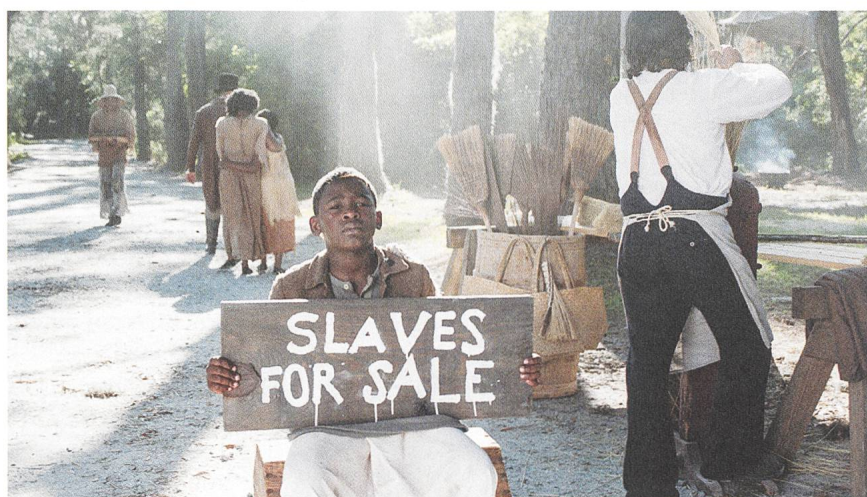
The Birth of a Nation Regie: Nate Parker