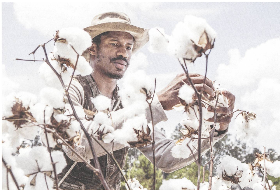
The Birth of a Nation Regie: Nate Parker