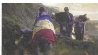
White Sun Tips EN