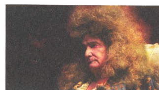
La mort de Louis XIV | Albert Serra Reviews Interviews FR