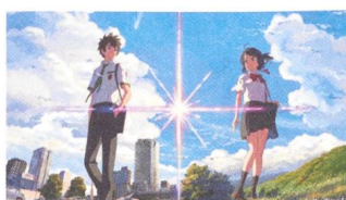
Your Name Tips FR