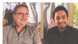
Kuosmanen & Haji | The Other Side of Hope Reviews Interviews EN