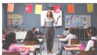
Manifesto Reviews EN