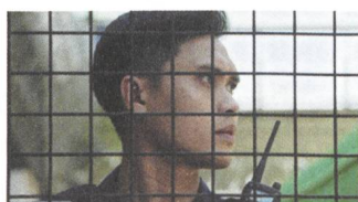
Apprentice Tips EN