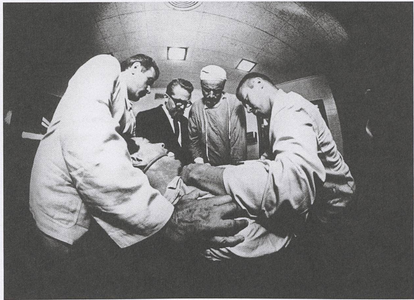
Seconds (1966) Regie: John Frankenheimer

In John Frankenheimers selten gezeigtem Seconds (1966) lässt sich ein frustrierter Bankangestellter aus New York in den Körper eines sehr viel jüngeren, attraktiven Kunstmalers transformieren. Doch die neue Identität mit neuem Gesicht und neuem Namen bedeutet nicht das Ende der alten. Der amerikanische Traum von Jugendlichkeit, Gesundheit und Erfolg platzt hier auf ebenso faszinierende wie erschreckende Weise. Kameramann James Wong Howe, 1899 geboren und zum Zeitpunkt des Films schon über vierzig Jahre als Director of Photography tätig, unterstützt mit extremen Weitwinkelaufstellungen und verzerrten Perspektiven Frankenheimers fast schon desolate Bilderfindungen und offenbart so die wachsende Skepsis des Regisseurs gegenüber jeder Technologie. Ein zutiefst verstörender Film.