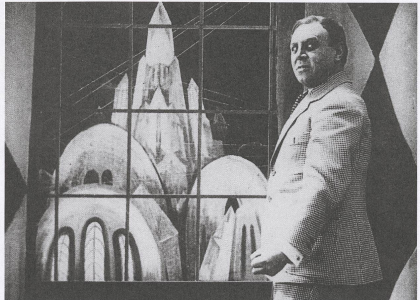
Algol. Tragödie der Macht (1920) Regie: Hans Werckmeister

Gog , 1954 von Herbert L. Strock inszeniert, zeigt, wie im Science-Fiction-Film der fünfziger Jahre das Fremde