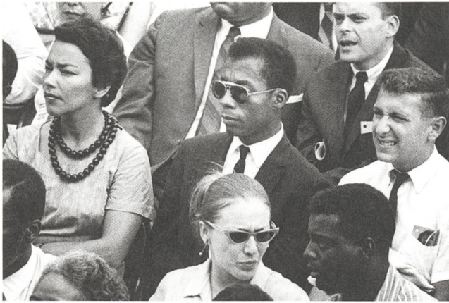
I Am Not Your Negro Regie: Raoul Peck