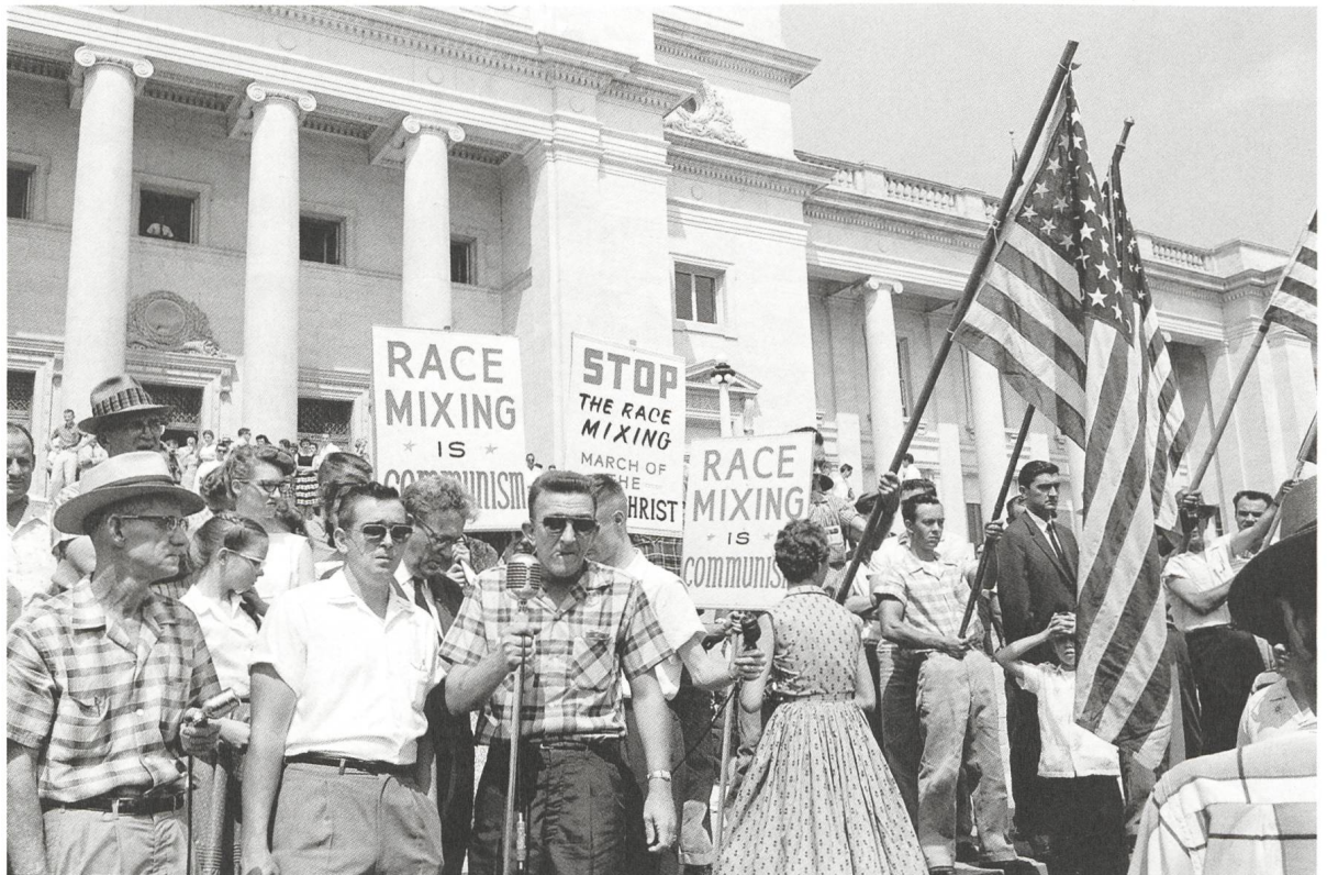
I Am Not Your Negro Regie: Raoul Peck