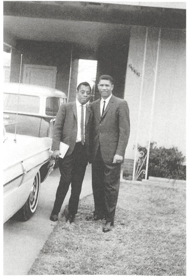
I Am Not Your Negro James Baldwin und Medgar Evers