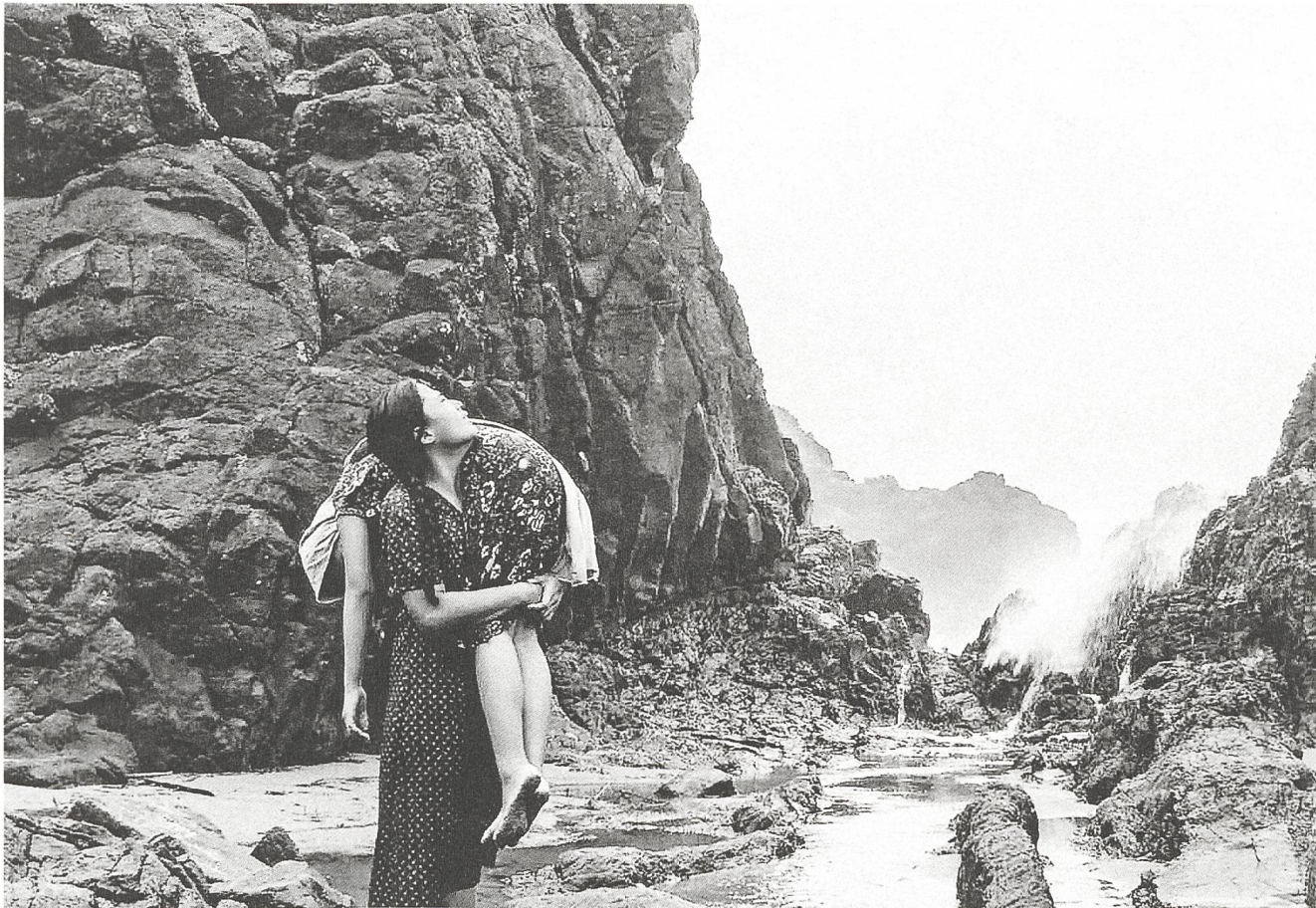
From What Is Before (2014) Regie: Lav Diaz