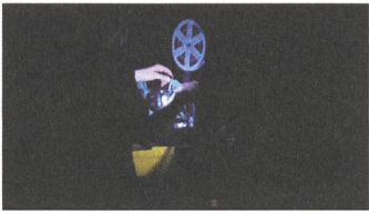
Der klingende Amateurfilm Reviews DE