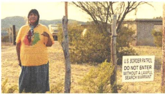
Borderland Blues Reviews DE