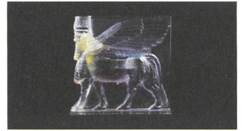
How much of this is fiction? Reviews EN