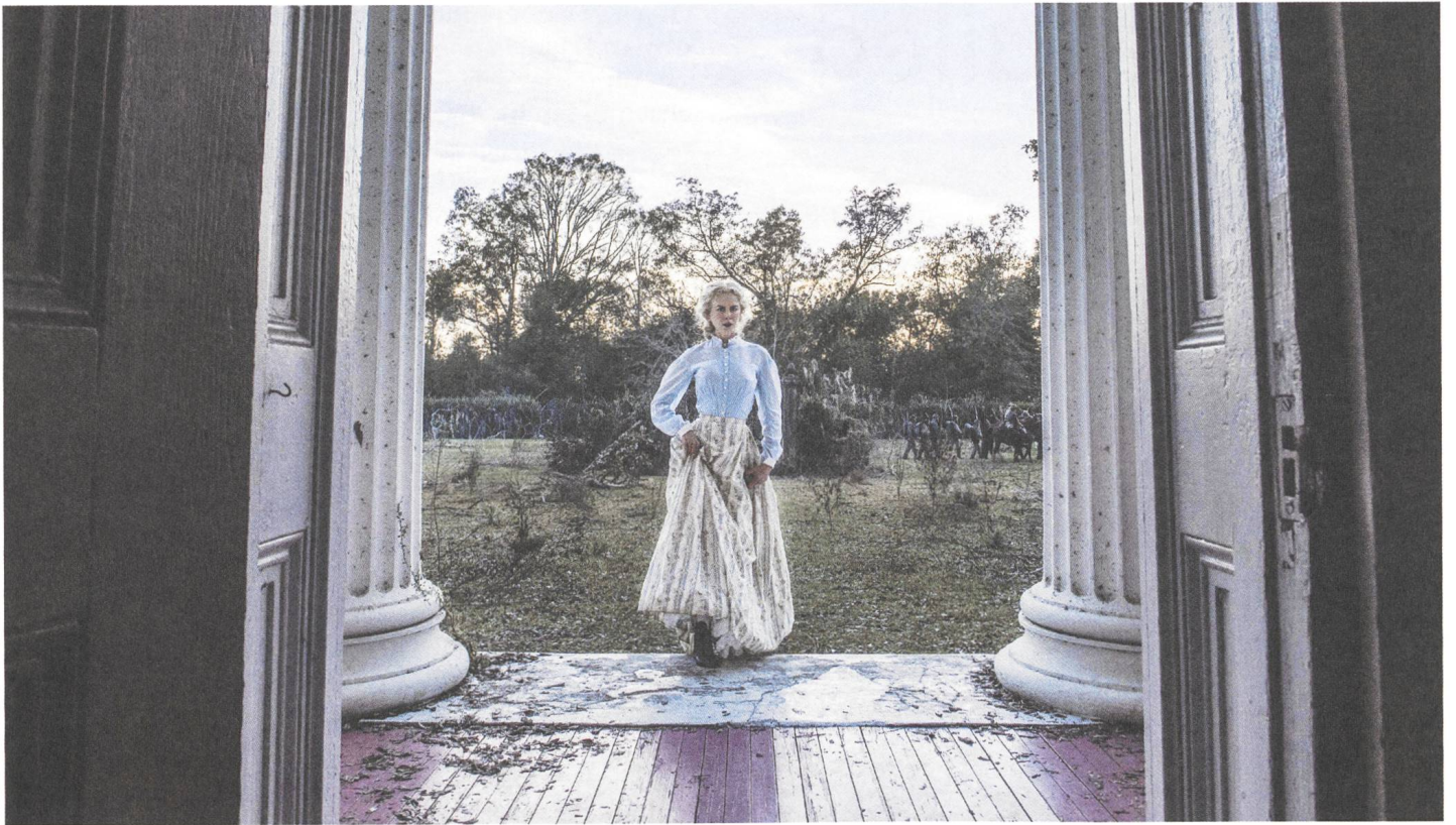
The Beguiled Regie: Sofia Coppola, mit Nicole Kidman als Martha Farnsworth