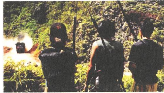
The Borneo Case Tips EN