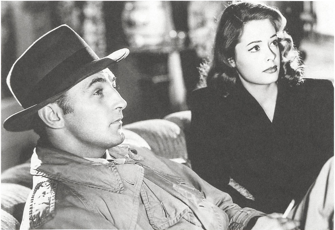
Out of the Past (1947) Regie: Jacques Tourneur, mit Robert Mitchum und Jane Greer