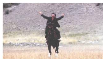
Centaur Reviews DE