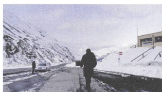
Calabria Reviews IT