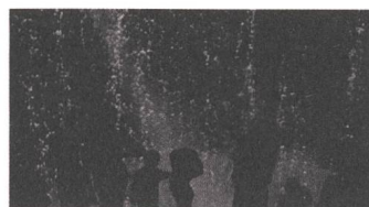
Supersonic Airglow Reviews DE