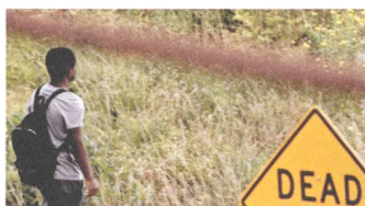
The Transfiguration Reviews DE