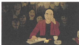
Have a Nice Day Reviews EN