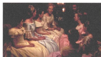
The Beguiled Reviews DE