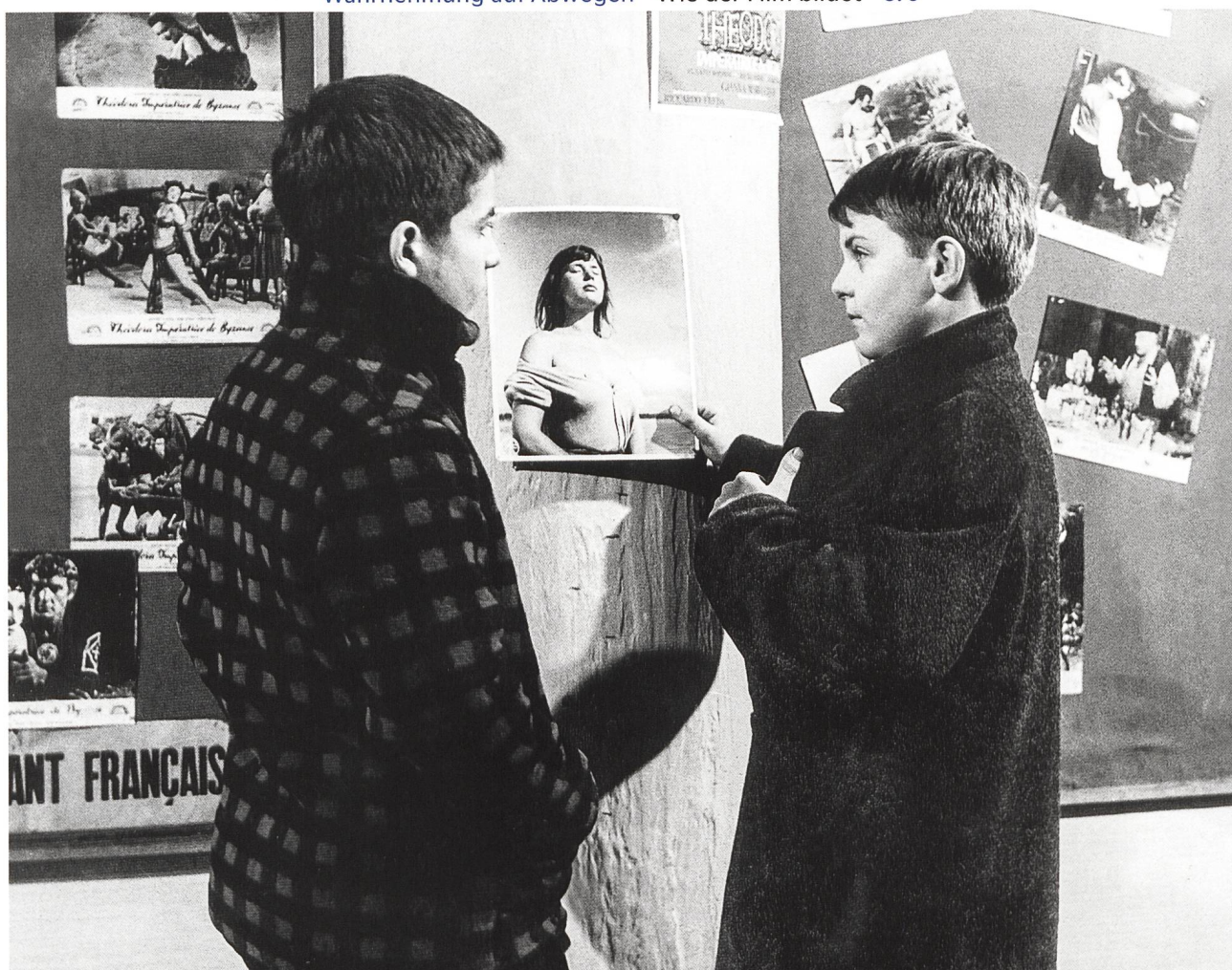
Wahrnehmung auf Abwegen Wie der Film bildet S. 6