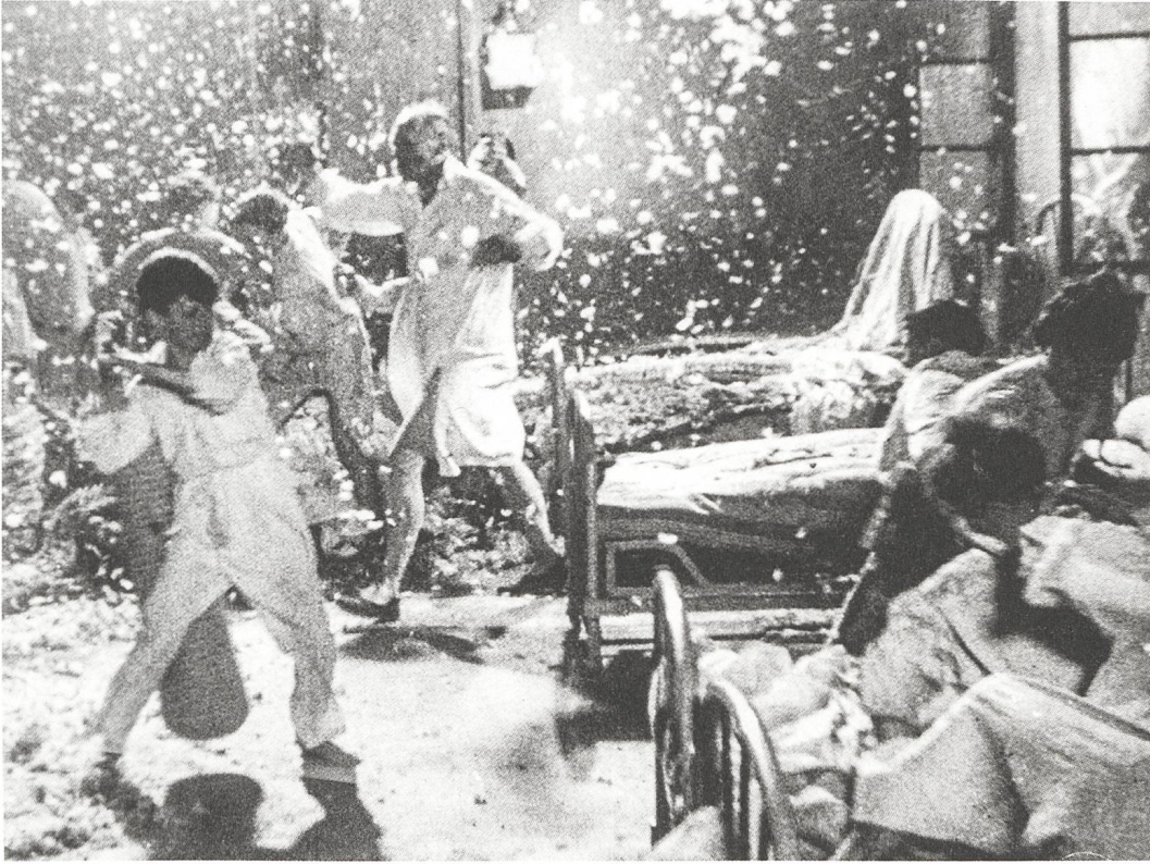
Zéro de conduite (1933) Régie: Jean Vigo

«Monsieur le Professeur, je vous dit merde!»