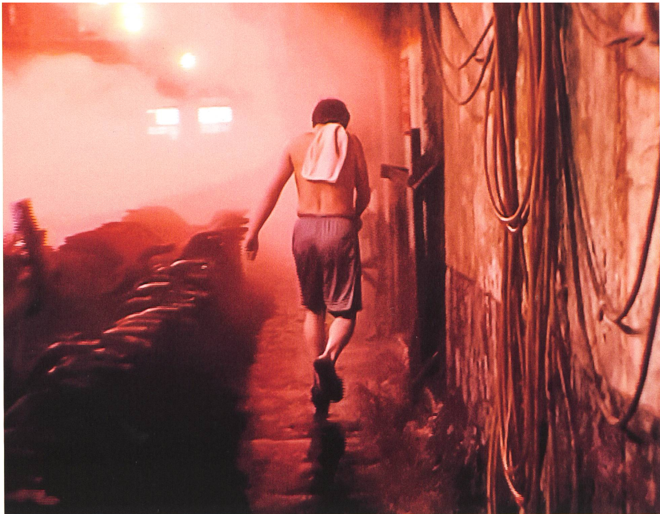
Wang Bing Der Humanist hinter der Kamera S. 50